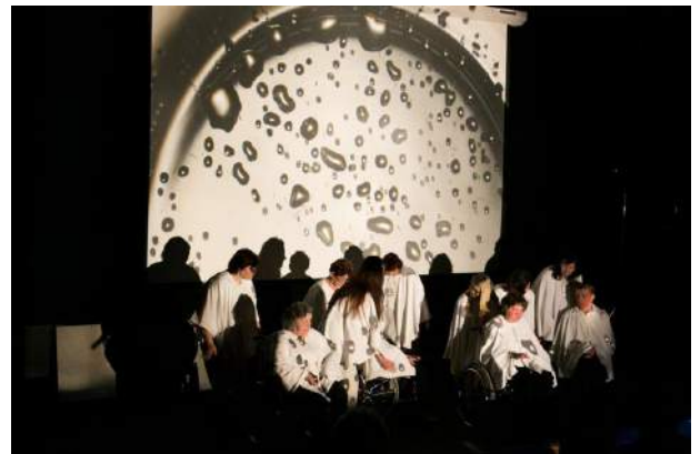
Jolitos Kimsaitės fotografijos.