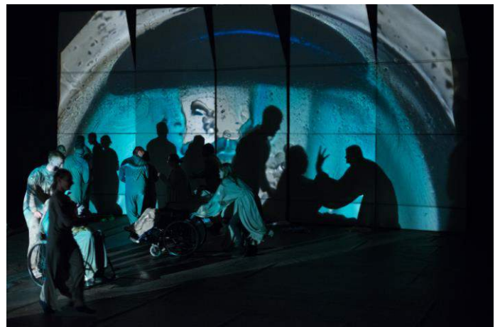
Teodoro Malinausko fotografijos.